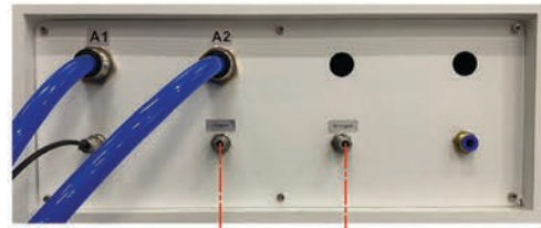
Задняя панель лазерной установки